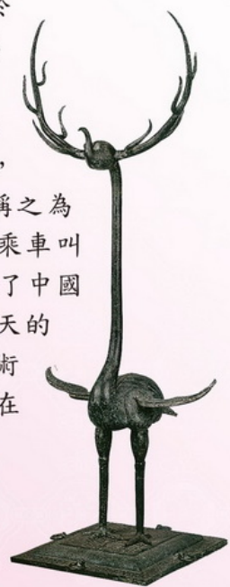
銅鹿角立鶴 戰國 (475-221 B.C.E) 高 143.5 公分 1978 年隨州曾侯乙墓出土 湖北省博物館藏

《銅鹿角立鶴》製作於戰國時代，是一件獨具風格的青銅工藝精品。鶴和鹿是長壽和吉祥的象徵。把鹿角插入鶴頭，將二者置于一身，可稱之為“瑞鶴”。古人把仙人乘車叫“鶴馭”、“鶴駕”反映了中國古代人們在死後成仙升天的思想。本件展品集藝術及文化思想為一體，實在