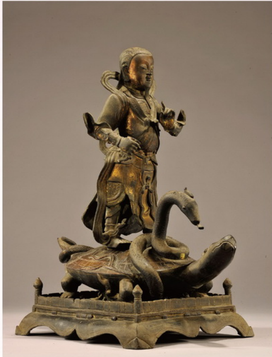
銅鑲金真武履玄武立像，明(1368-1644) 高 75.5 公分，武當山道教協會藏品

其他展品包括新石器時代的太陽人神像、明代武當山針灸銅人像，以及武當山道教法器、造像、符籙，以及其它若干道教文物，完整地概括了道教的產生、發展過程及各種道教科儀方面的情況。