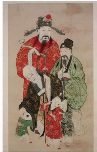
佚名《福祿壽三星祝壽圖》 清 (1644-1911) 長 113 公分，寬 75 公分 湖北省博物館藏品

鑲金銅玄武明 (1368-1644) 高 47 公分 長 63 公分 寬 44.5 公分 湖北省博物館藏品