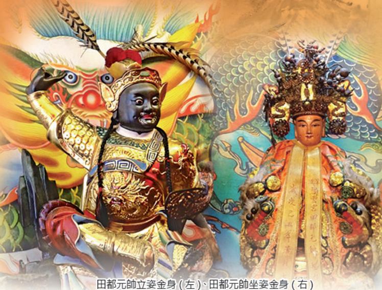
田都元帥立姿金身(左)·田都元帥坐姿金身(右)

內政部全國宗教資訊網·田都元帥： https://religion.moi.gov.tw/Knowledge/Content?ci=2&cid=256