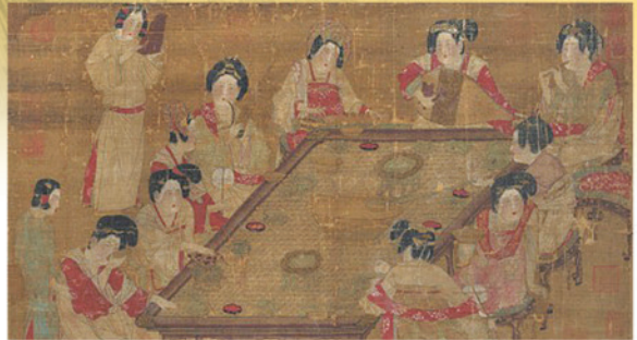
唐代宮樂圖(右上角的女子吹奏的樂器為箏篋)

一唱而紅梅破綻，蕙一調而庶明風起。」的極高程度，同時他也培養出了許多優秀的樂師與弟子，徒子徒孫遍及閩地，是為一代戲曲大師。